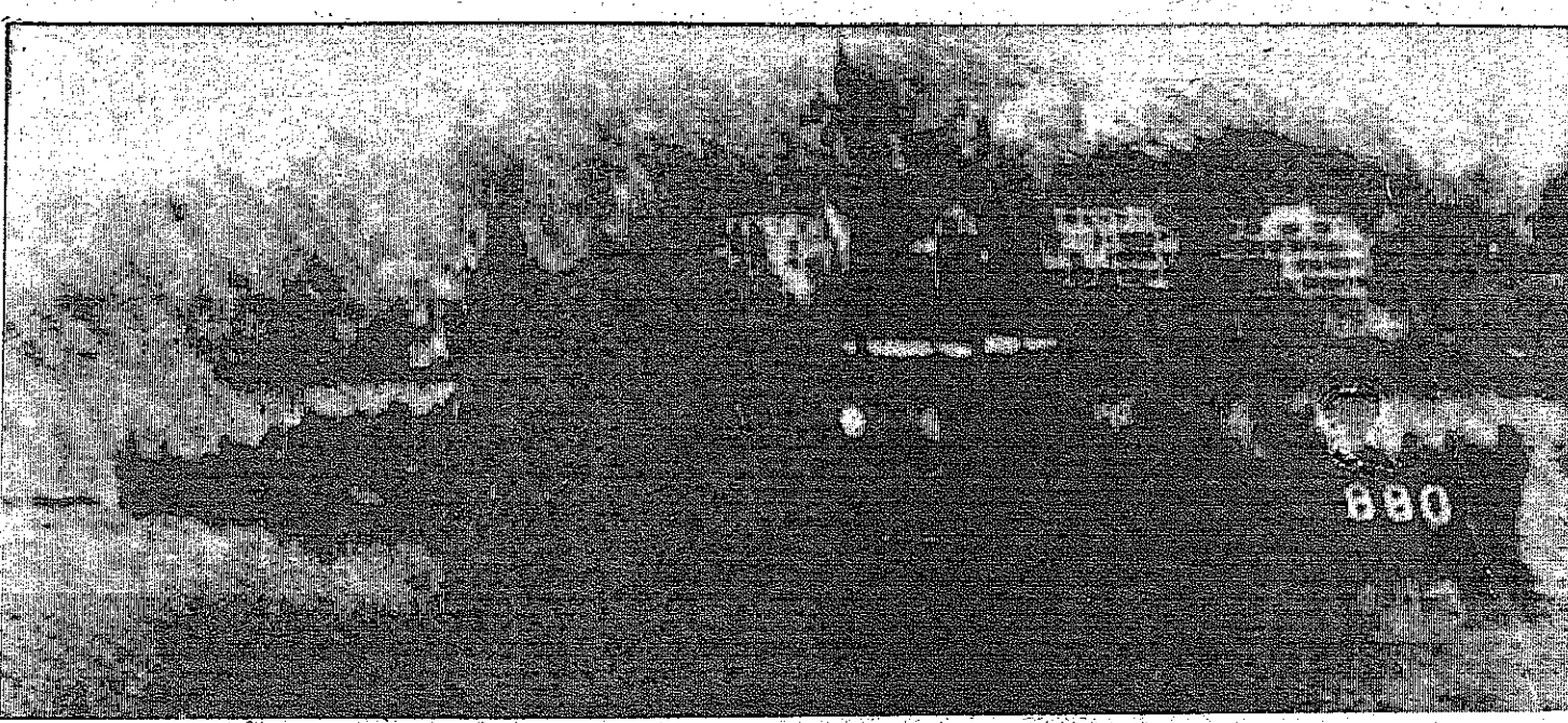
الجمعة الاميركية ( ديبس ) وهي جناز مضيق اليوسفور باتجاه البحر الاسود صباح أمس المبارك

اميزات معقولة كما ان الجمهورية العربية المتحدة والاردن على استعداد لذلك في حدود الحق لا التسليم والاستسلام . ان قيلت الوثائق بقرار مجلس الامن الداعي لانسحاب اسرائيل من المناطق المحتلة وانها حالة الحرب مع اسرائيل مقابل منحها الملاحة الحرة في قناة السويس ومضائق تيران كما ان الجمهورية المتحدة وافقت على عودة قوات الطوارئ الدولية الى المناطق المحتلة . وقد رفضت الجمهورية المتحدة والاردن خطة امريكا الداعية الى حل كل منهما قضايها مع اسرائيل على حدة وكان رئيس وزراء الاردن السيد بهجت القلبي قد دعا في نهاية الاسبوع الماضي الى عمل عربي موحد من اجل تحرد المناطق العربية المحتلة في حالة فشل الحل السياسي وقال ان الاردن ساند مهمة الوساطة الدولي غونار بارنغ الى اخر مراحلها بقصد اتجاها صريح بان انسحاب اسرائيل ان يكون كايلا ولن نرضى بتجزئته على مراحل او بتأجيله . وبعد محادثات سكراتون مع الزعماء العرب صرح بأنه قد يقترح على نيكسون تحولا في سياسة امريكا التي اعتبره العرب لصالح اسرائيل . ولدى وصوله الى العالم العربي صرح سكراتون بأنه لا يتوقع تقريبا جوهريا فوراً في السياسة الاميركية ولكنه عندما اجازت جسر الملك حسين